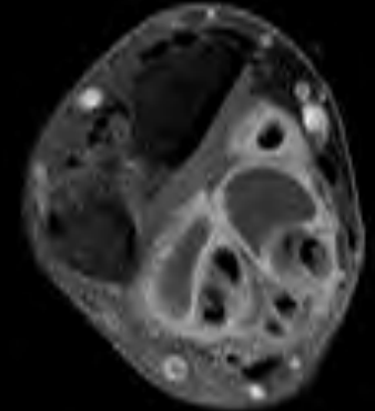
造影後脂肪抑制T1強調像